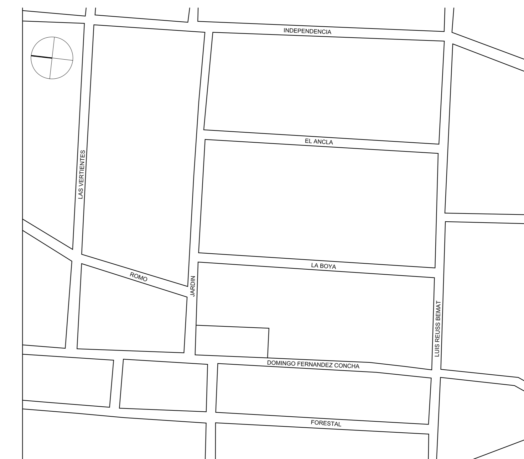
PLANO DE UBICACION