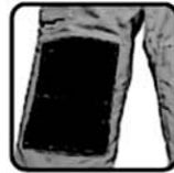
Refuerzos para rodilla en AraShield