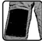
Refuerzos para rodilla en AraShield