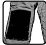
Refuerzos para rodilla en AraShield