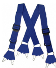
Suspendores Intercambiables con presillas de ajustes rapido