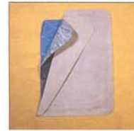
Capa adicional de almohadilla de aramida para mejorar acolchado en rodilla