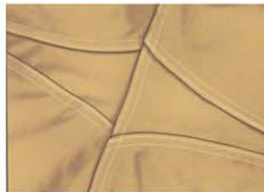
Fuelle en entrepiernas