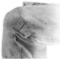
Con sistema que permita total movimiento en rodilla