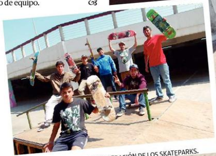
PARTE DE LA CUADRILLA DE RECUPERACIÓN DE LOS SKATEPARKS.

se comprometan con este proyecto de recuperación, cuentan con una cuadrilla de trabajo más o menos definida donde se cuentan algunos soldados, pintores y carpinteros con los cuales logran mejorar los desperfectos físicos de las estructuras, un verdadero trabajo de equipo.