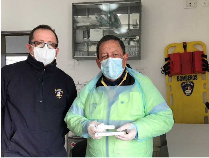
Foto equipo DMN enfermería Campus